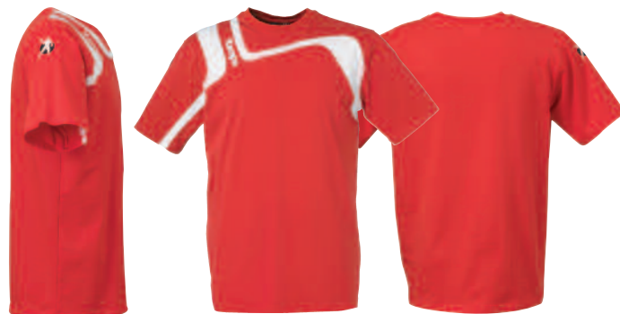
01 red/white 01 rojo/blanco