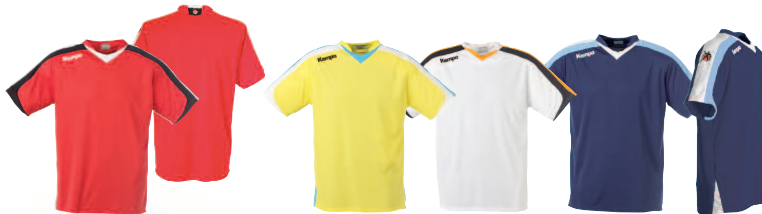
01 red/white/black 01 rojo/blanco/negro

Art. 20 03754 Material Sens2Touch SoftFlex, 100% Polyester Sens2Touch SoftFlex, 100% Poliéster Size Talla S, M, L, XL, XXL, XXXL