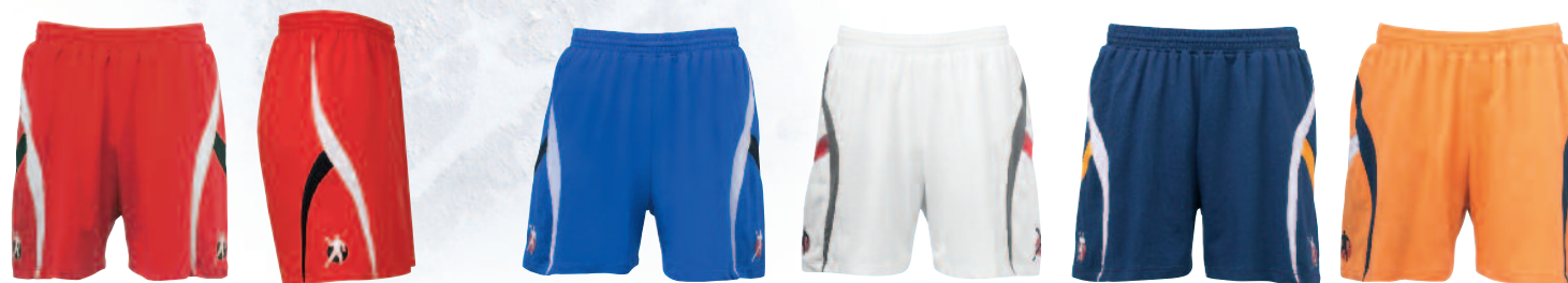
01 red/white/black 01 rojo/blanco/negro