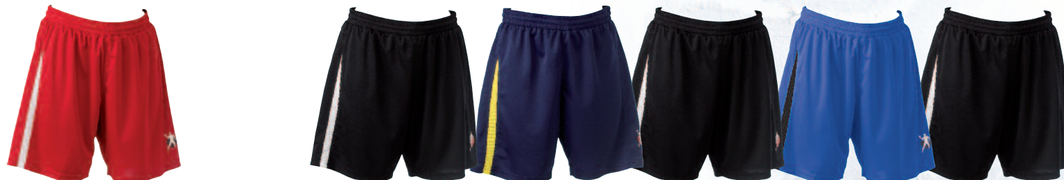
01 red/white 01 rojo/blanco

Material 100% Polyester, plain Insert material: 100% Polyester, Mesh Material principal: 100% Poliéster liso Material de las inserciones: 100% Rejilla de Poliéster Size Talla XS, S M, L, XL, XXL