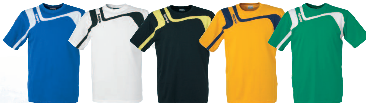
02 royal/white 02 royal/blanco