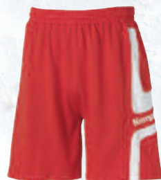
01 red/white 01 rojo/blanco