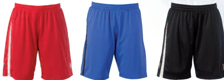
01 red/white 01 rojo/blanco