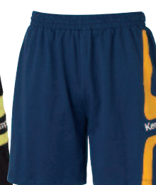
05 navy/orange 05 azulmar/naranja