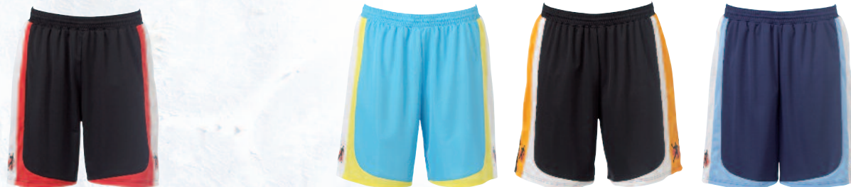
01 black/white/red 01 negro/blanco/rojo

Art. 20 03539 Material Sens2Touch SoftFlex, 100% Polyester Sens2Touch SoftFlex, 100% Poliéster Size Talla S, M, L, XL, XXL, XXXL