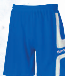
02 royal/white 02 royal/blanco