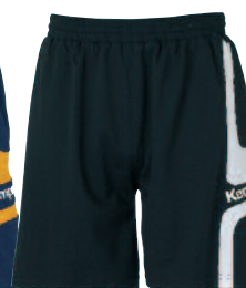
03 black/white 03 negro/blanco