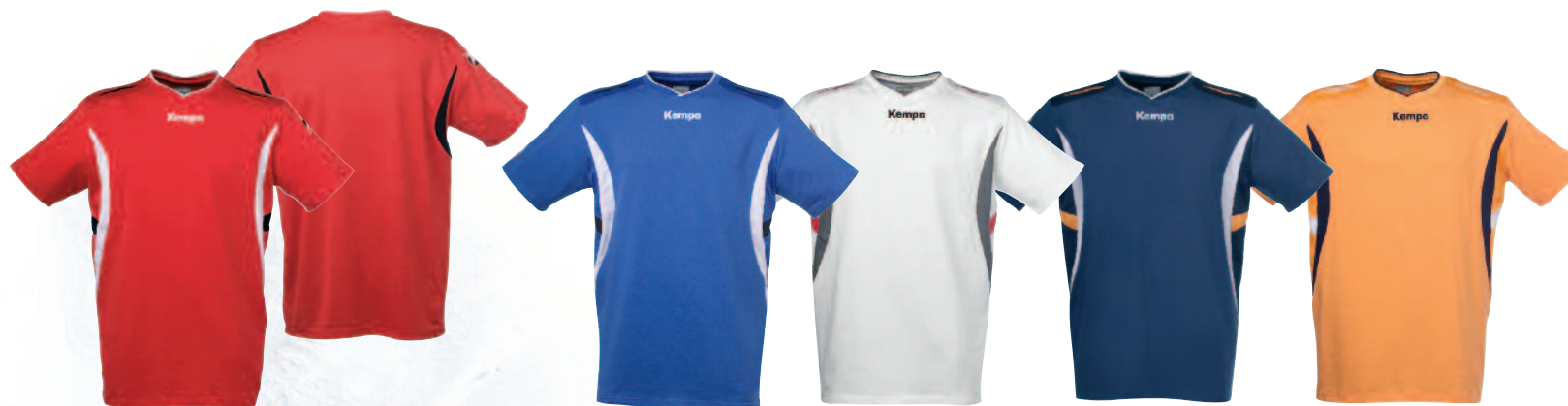
01 red/white/black 01 rojo/blanco/negro