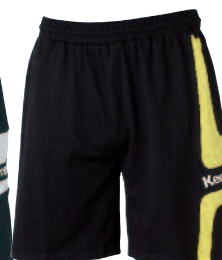
04 black/lime 04 negro/lima