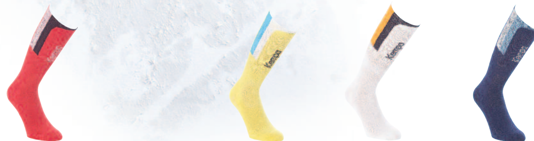
02 red 02 rojo

Art. 20 03540 Material 80% Cotton, 10% Polyester, 10% EA 80% Algodón, 10% Poliéster, 10% EA Size Talla 36-40, 41-45, 46-50