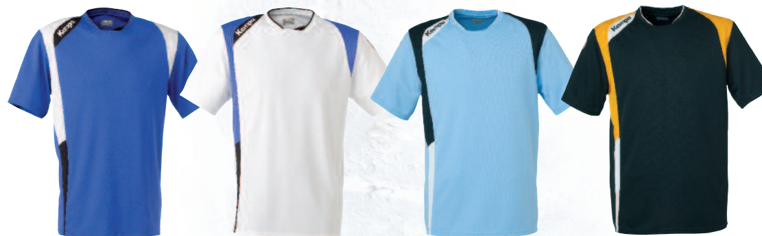
05 royal/white/black 05 royal/blanco/negro