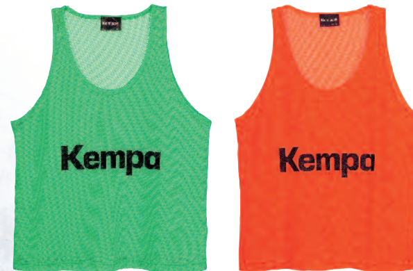
01 green 01 verde