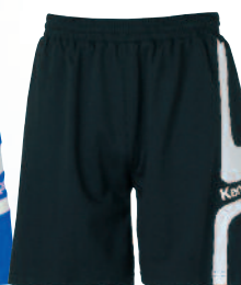
03 black/white 03 negro/blanco