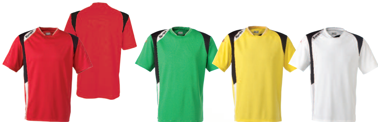
01 red/black/white 01 rojo/negro/blanco