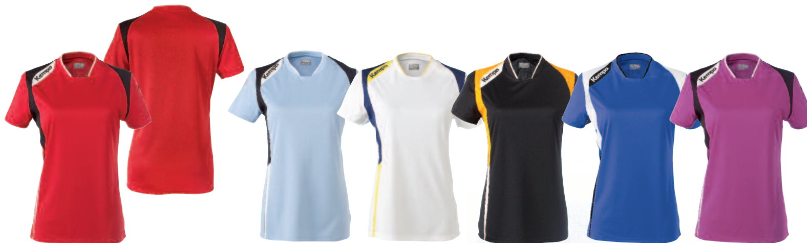
01 red/black/white 01 rojo/negro/blanco

Material Main material: 100% Polyester plain Insert material: 100% Polyester, Mesh, Collar material 97% Polyester, 3% EA 1:1 rib Material principal: 100% Poliéster liso Material de las inserciones: 100% Rejilla de Poliéster Material del cuello: 97% Poliéster y 3% EA 1:1 Rib Size Talla XS, S M, L, XL, XXL