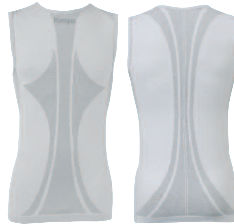
01 silver 01 plata

Art. 20 02037 Material 82% Nylon, 18% Polyester 82% Nailon, 18% Poliéster Size Talla S/M, L, XL/XXL