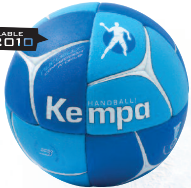
04 royal/cyan/white 04 royal/cyan/blanco