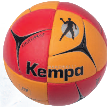
02 red/orange/black 02 rojo/naranja/negro