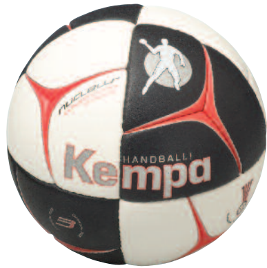
03 white/black/red 03 blanco/negro/rojo