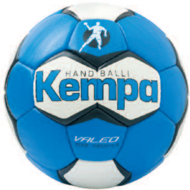
01 royal/white/royal 01 royal/blanco/royal