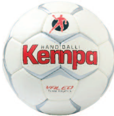
04 white/red/silver 04 blanco/rojo/plata