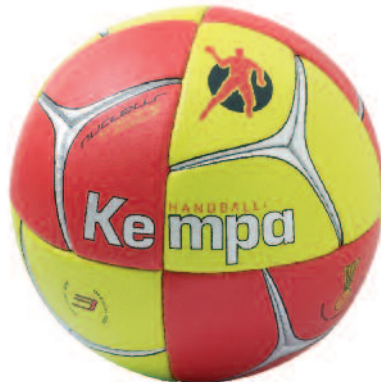
06 red/lime/silver 06 rojo/lima/plata