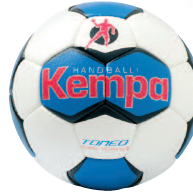
02 white/royal/red 02 blanco/royal/rojo