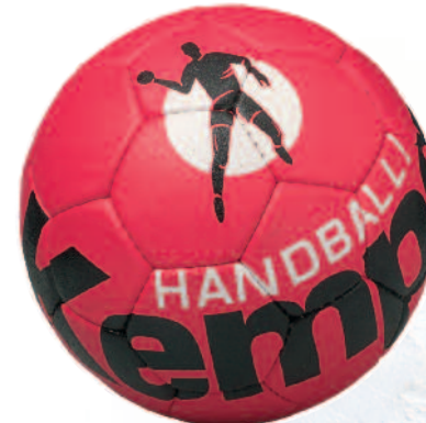
02 red/black/white 02 rojo/negro/blanco