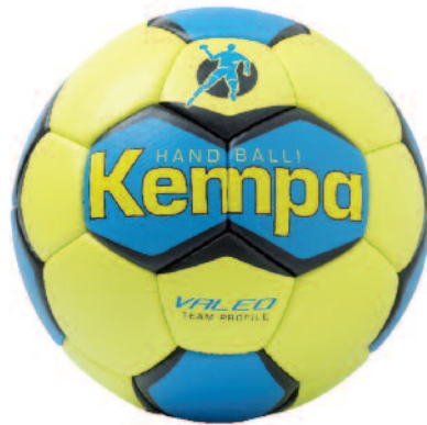
03 lime/cyan/lime 03 lima/cyan/lima