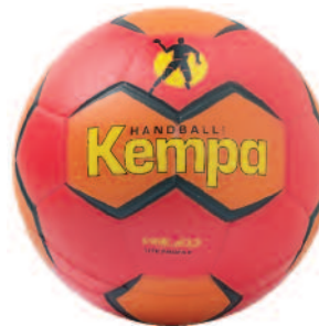
01 red/orange/yellow 01 rojo/naranja/amarillo