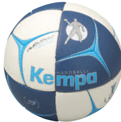
05 white/navy/cyan 05 blanco/marino/cyan