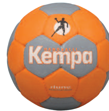
02 orange/anthra/white 02 naranja/anthra/blanco