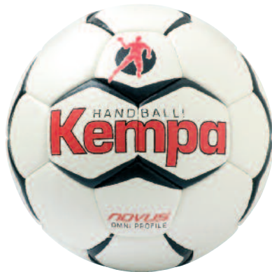
01 white/black/red 01 blanco/negro/rojo