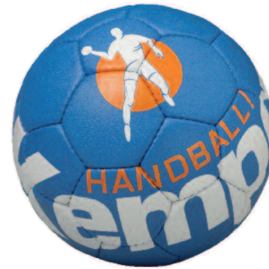
01 royal/white/orange 01 royal/blanco/naranja