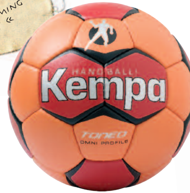
01 orange/red/silver 01 naranja/rojo/plata

X revised playing and flight characteristics » revised rebound » excellent grip and roundness » excelentes características de juego y vuelo. » excelentes propiedades de rebote. » excelentes agarre y redondez