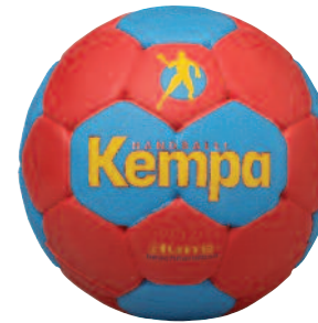
01 red/cyan/yellow 01 rojo/cyan/amarillo