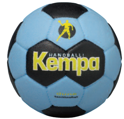
03 skyblue/black/yellow 03 cielo/negro/amarillo