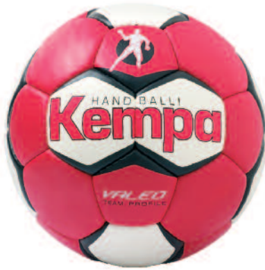
02 red/white/red 02 rojo/blanco/rojo