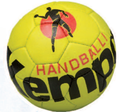
03 lime/black/red 03 lima/negro/rojo